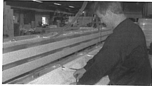
SRI Sign Solution har udviklet et blot 6 mm dybt LED-reklameskilt.

Tip redaktionen om en historie Send til en kollega Skriv en kommentar til artiklen